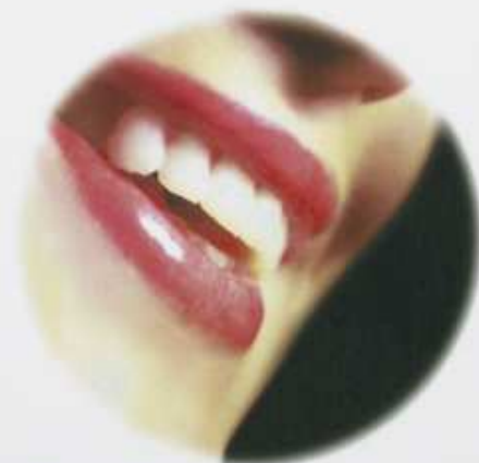
白くきれいな歯は周りの人にも好印象を与えることでしょう。